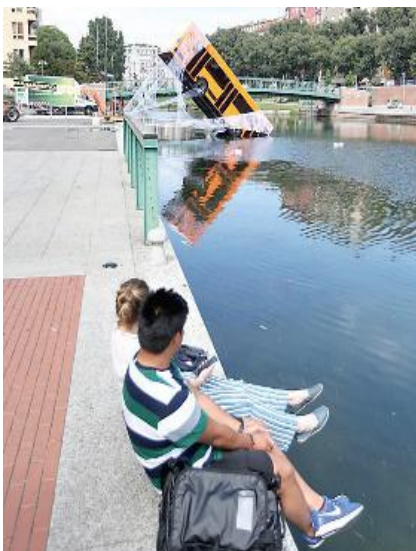
MILANO Un autobus è finito nel Naviglio in darsena? No, solo una campagna pubblicitaria che non ha mancato di attirare l'attenzione