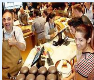
Starbucks, folla in attesa e festa vip Edizione Milano