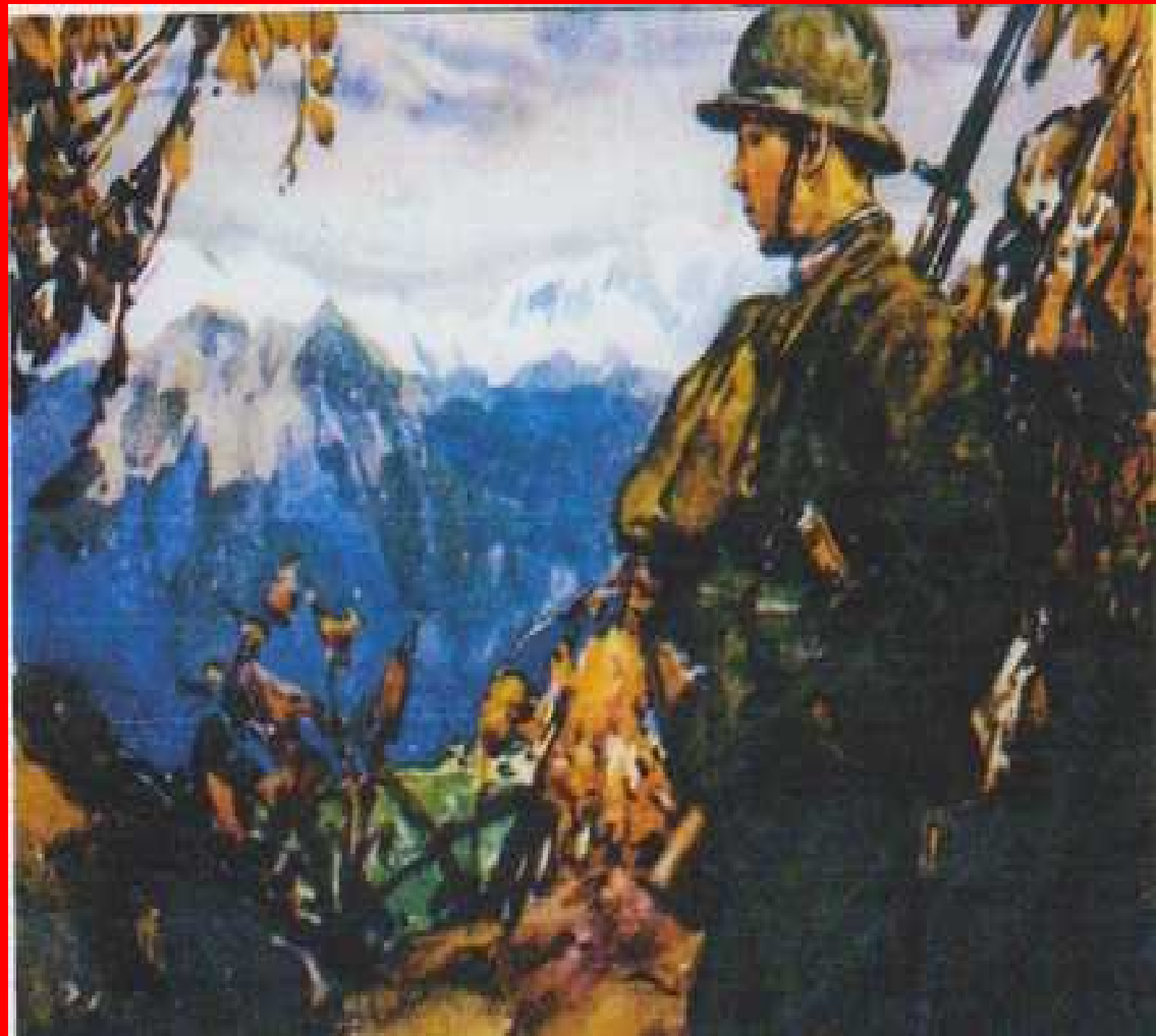
2 Dipinti del legionario B. Bartos