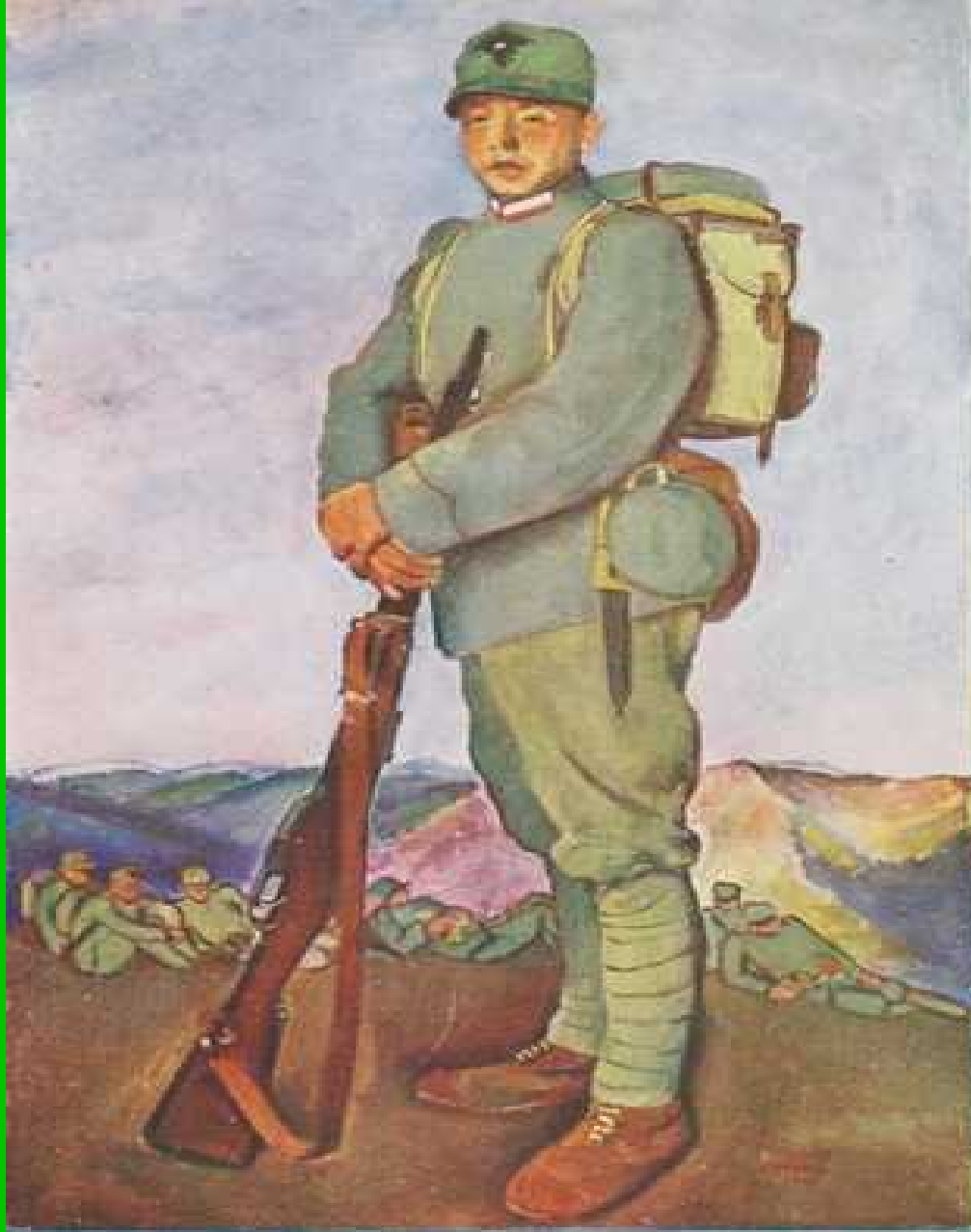
Legionario del corpo d'armata ceca