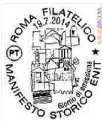
L'annullo del primo giorno riguardante il manifesto dell'Enit

Attesa per domani, servirà, perlomeno, a coinvolgere residenti e villeggianti. Le iniziative di valorizzazione