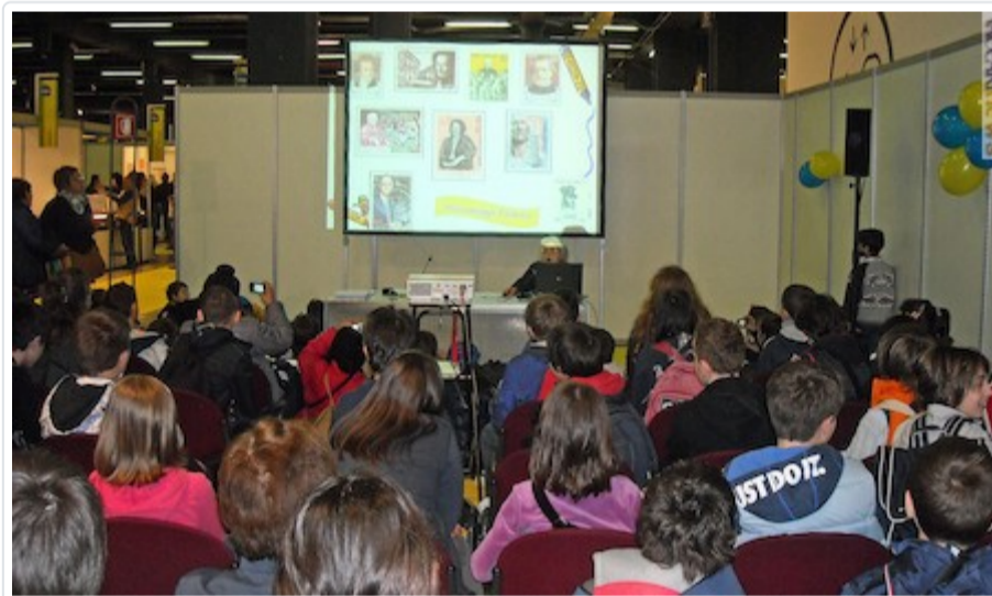
Al lavoro con i bambini a "Milanofil"; era il 2012

Il suo impegno per la Federazione fra le società filateliche italiane