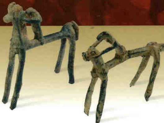
Mesopotamia, 1000 a.C. circa statuette bronzee rappresentanti cavallo e cavaliere