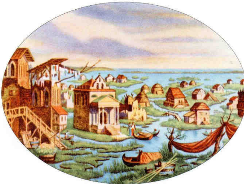
Una veduta fantastica dell'antica Venezia. Da: "La Gloria di Venezia" (a cura: "Manifattura Lane Gaetano Marzotto & Figli S.A. Valdagno"), Industrie Grafiche N. Moneta, 1941, Milano.

Quella regione prese il nome di Veneto, facendo proprio il nome di quei nuovi arrivati.