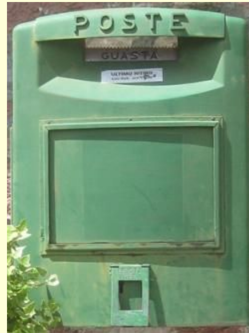
Tavernola Bergamasca BG 2010 Druogno VB, frazione di Sagrognò 2010 (da Ugo Delpini)