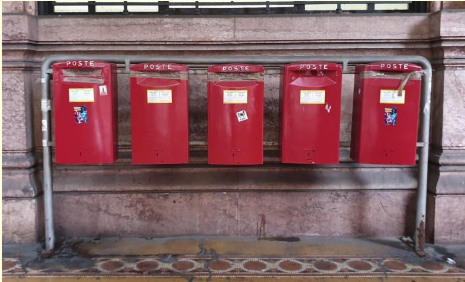
Genova 2023 (da Maurizio Amato)