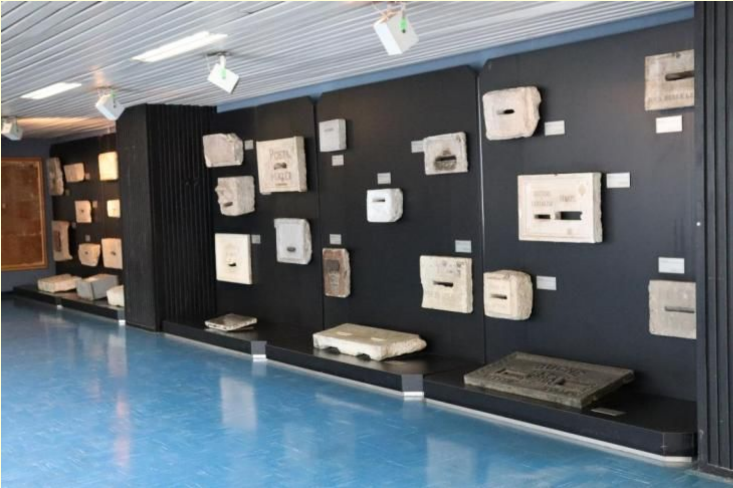
Antiche buche d'impostazione (Museo storico della comunicazione - Roma)