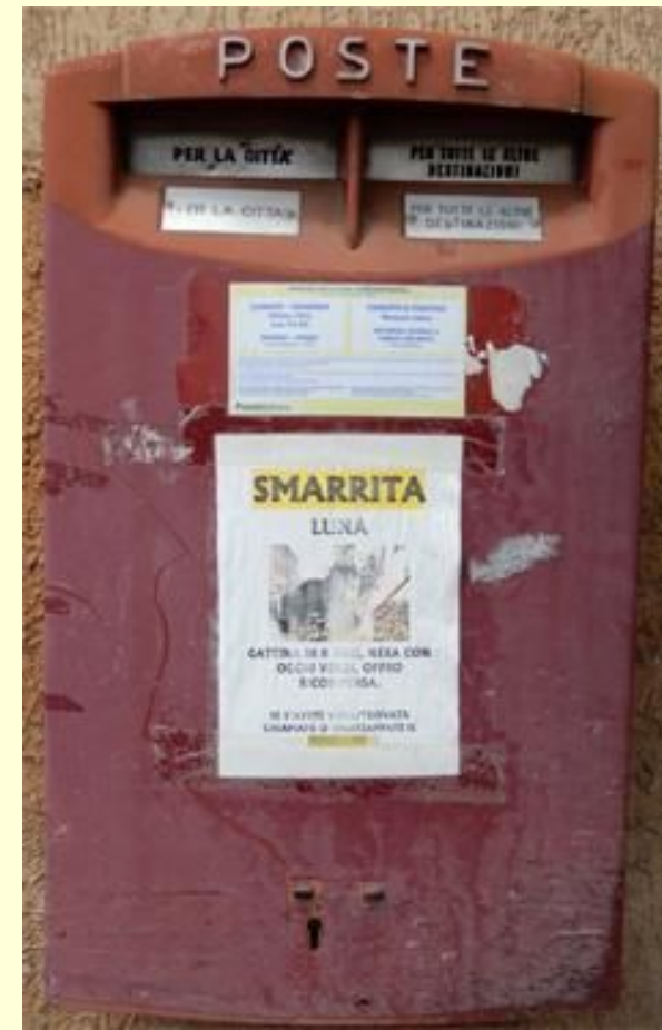
Otranto LE 2012, Anzio RM 2014, Vicenza 2021