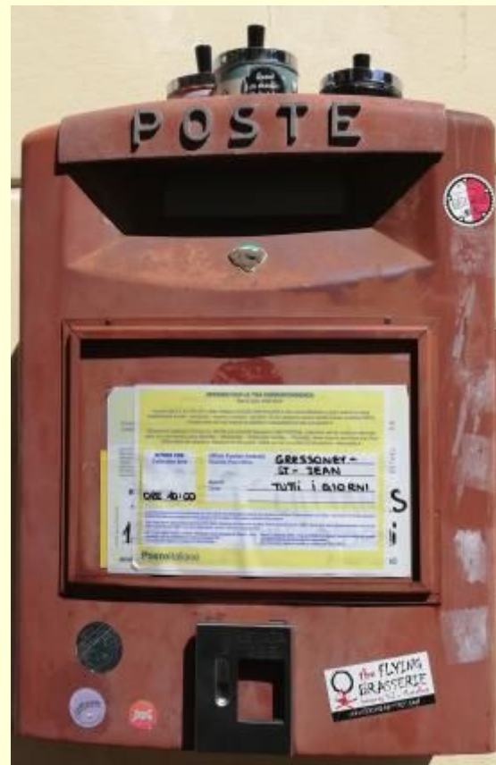
Aosta e Gressoney-Saint-Jean AO 2021