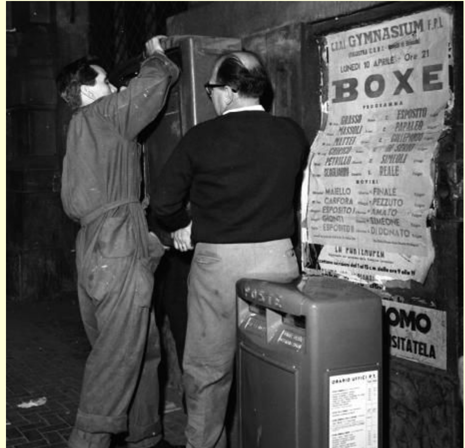
Il montaggio delle cassette, Napoli 8-9 aprile 1961