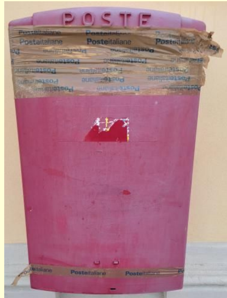
Firenze 2018, Varese 2022 (da Giancarlo Rota)