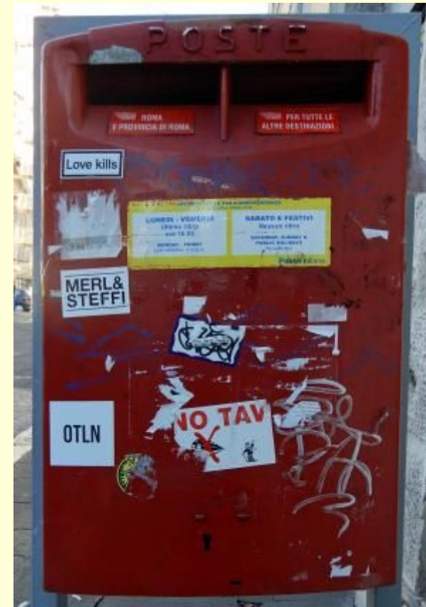
Rimini 2011, Andria BT 2012, Roma 2019