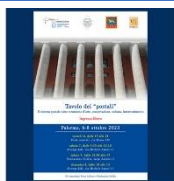
"Tavolo dei «postali»" Palermo, Sicily: 6-8 October

From 6 to 8 October, Palermo hosted the third physical meeting "Tavolo dei «postali»" (Postmen's Table).