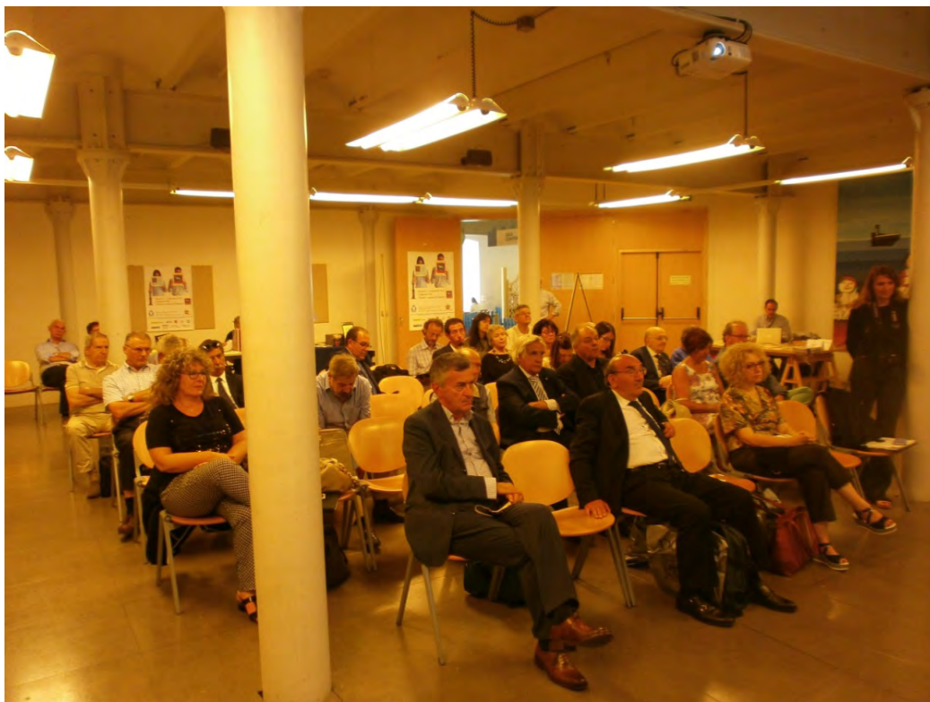
Pubblico sempre attento ed attivo.