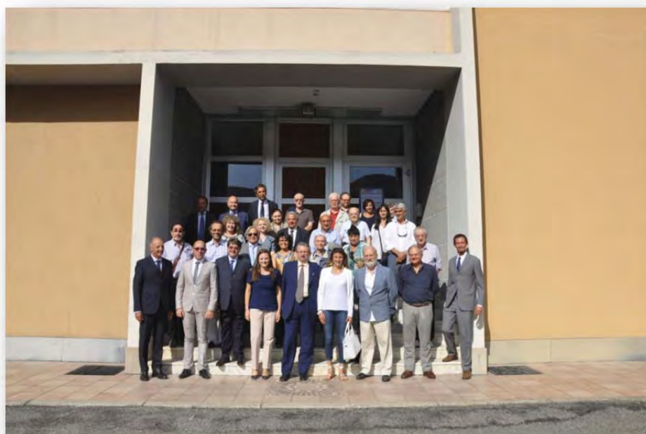
I partecipanti davanti allo stabilimento Marini.